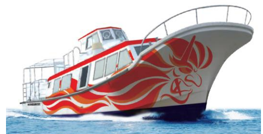
観光遊覧船（イメージ）