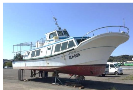
↑シーバード（リニューアル前）

※ 船の名称については、粟島浦村への敬意を表し、同村にて運航していた名称「シーバード」をそのまま使用します。