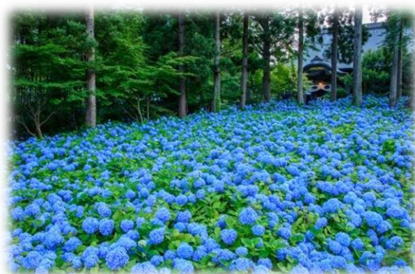
↑ 雲昌寺のアジサイ