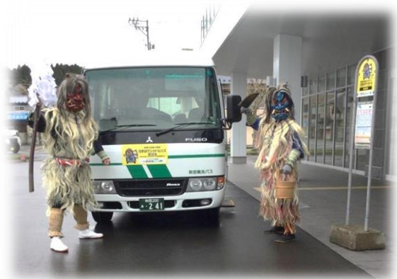
↑ なまはげシャトルバス （4/27 運行初日の様子）