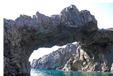
↑大栈橋（だいさんきょう）