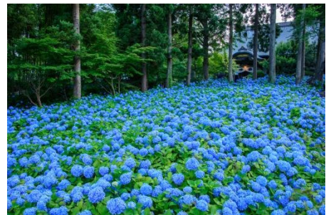
↑ 雲昌寺のアジサイ

※ バス運行日以外の日も、同時刻・同ルートで、事前予約制のあいのリタクシー「なまはげシャトル」が運行します（6/15～7/15は、バス同様「雲昌寺」に停車します）。