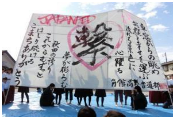
【参考】秋田県立角館高等学校書道部による書道パフォーマンスの様子（音楽に合わせて書き上げます）