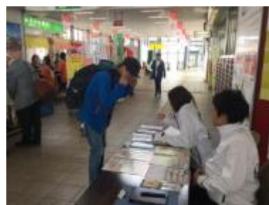
ご案内イメージ(昨年の弘前駅)