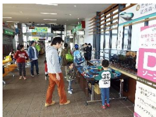
あずましフェスタの様子 （プラレール展示）