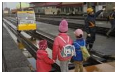
あずましフェスタの様子 （レールスター試乗）