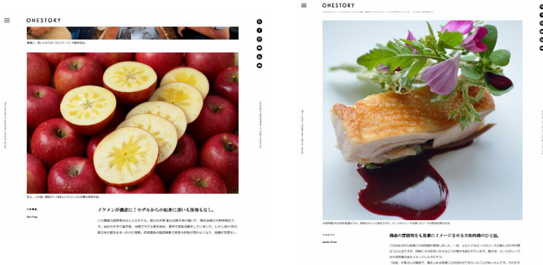
掲載イメージ（ONESTORY HP より）