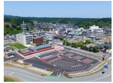
↑道の駅おが（オガーレ）

男鹿線沿線の景色を楽しみながら歩くイベントです。ロングコース（17～20km程度）とミドルコース（10～13km程度）の2つのコースを設け、ニーズに合わせてお楽しみいただけます。