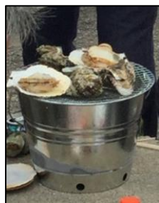
海鮮バーベキュー