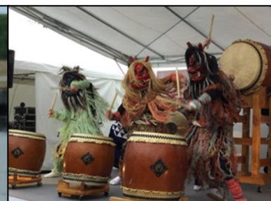
男鹿海洋高等学校郷土芸能部 「なまはげ太鼓」