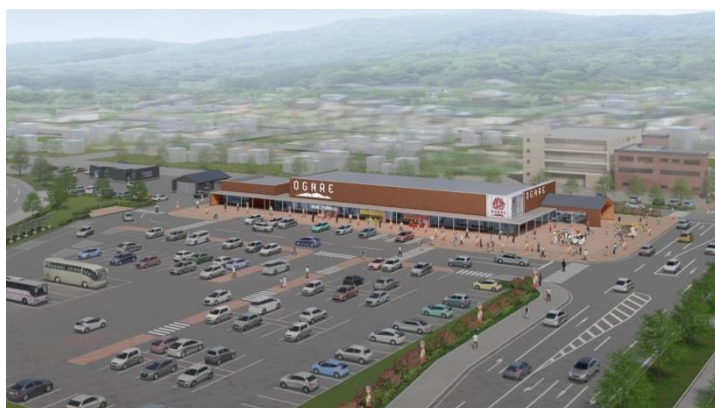
【男鹿市複合観光施設「オガレ」完成イメージ】