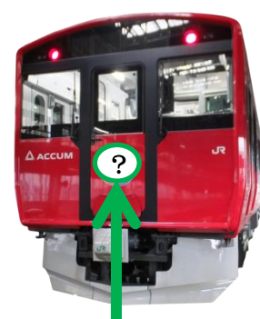
【応募フォーマット】 【ヘッドマーク掲出位置】