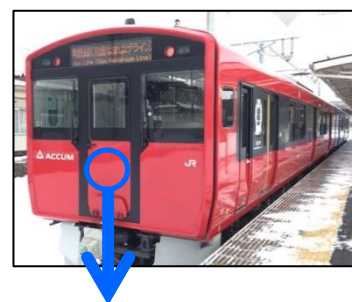
【応募フォーマット】 【ヘッドマーク掲出位置】