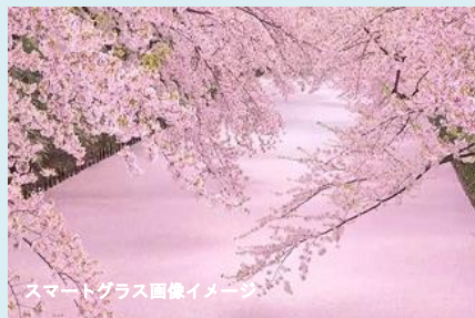
スマートグラス画像イメージ