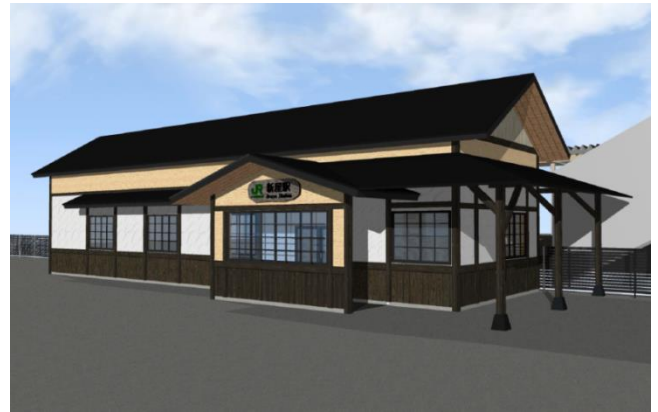
駅舎リニューアルイメージ