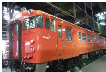
〔朱 5 号〕気動車イメージ