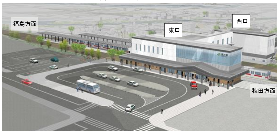
奥羽本線 湯沢駅 完成イメージ図