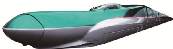
〈 E5系車両 〉