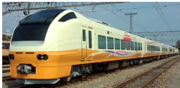
〈 E653系車両 〉

新潟～秋田間運転の特急「いなほ」3往復全てに、E653系を導入し到達時分の短縮と快適性の向上を図ります。 東京～羽後本荘間は、これまでよりも最大16分短縮します。