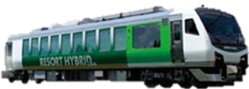
(リゾートビューふるさと)

長野県内のびゅうプラザ・主な駅にて発売をいたします。お電話でのお申し込みはびゅう予約センター (TEL: 026-227-6809 毎日 10 時~18 時) まで!