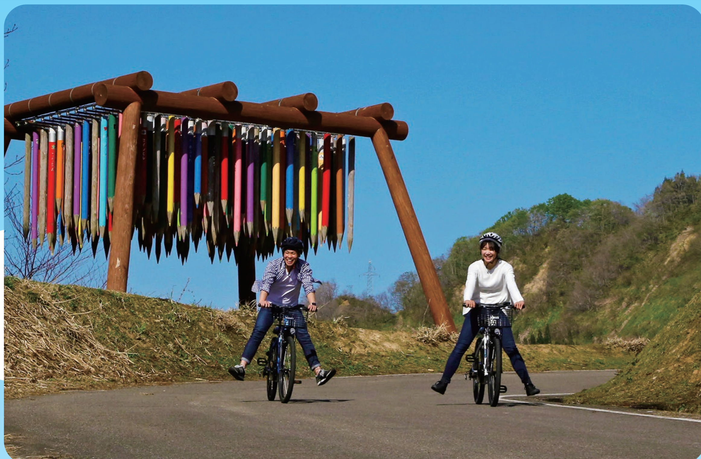
バスカル・マルティン・タイユ「リバース・シティ」

https://www.tokamachishikankou.jp/spot/e-bike/