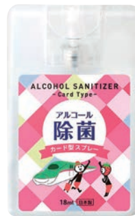
JRオリジナルカード型除菌スプレー