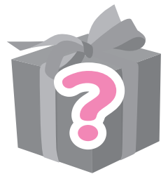
JRオリジナルグッズ