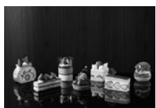
宮城県亶理町山元町産イチゴ「もういっこ」