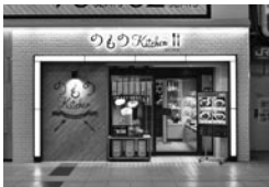
ものキッチン池袋東口店