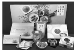
仙台きなこシリーズ