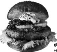
別格信州ジビエザ★鹿肉バーガー

地域の魅力ある素材を掘り起こし（1次産業）、優れた加工技術等（2次産業）を組み合わせて、お客さま視点を踏まえた商品開発と販売（3次産業）を推進する、ものづくりプロジェクトです。