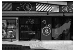
もの居酒屋“かよひ路”上野店