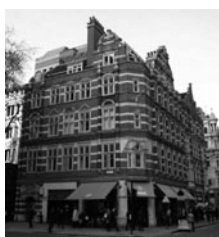
ロンドン事務所 (2014年4月開設)