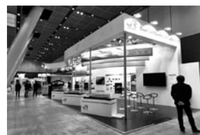
UIC世界高速鉄道会議への出展