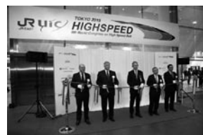
UIC世界高速鉄道会議