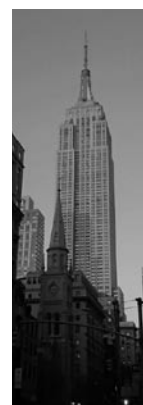
ニューヨーク事務所 (1964年1月開設)