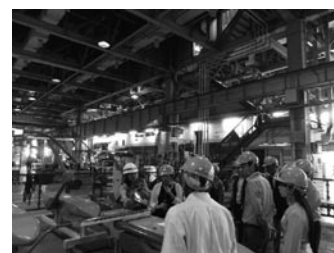
駐日大使館運輸担当官 テクニカルビジット (新幹線総合車両センター)