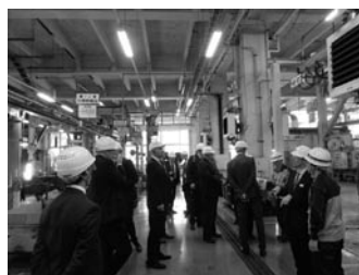
ドイツ鉄道との交換研修における東京総合車両センター視察