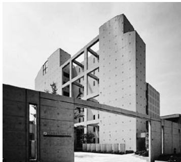
寮「ドルミエール大塚」