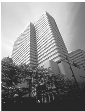
利用補助施設 「ホテルメトロポリタン(池袋)」