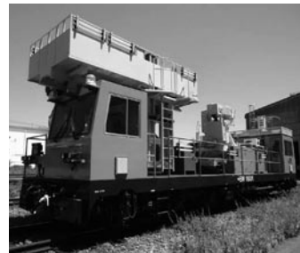
バケットワゴン(新幹線)

新幹線と在来線の2種類があり、高所設備の点検、検査に用います。多関節をもったブームとバケット内の操作パネルで電線や支持物を自在によけながら高所(15m)にある設備まで近づくことができます。