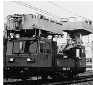
マルチメンテナンスワゴン

機能として「架線支持ブーム」「エレベーター機能を持ち回転する広い作業台」「クレーン」により作業性の向上をはかった改良型です。