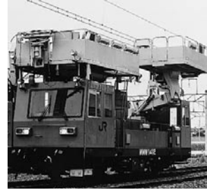
マルチメンテナンスワゴン

機能として「架線支持ブーム」「エレベーター機能を持ち回転する広い作業台」「クレーン」により作業性の向上をはかった改良型です。