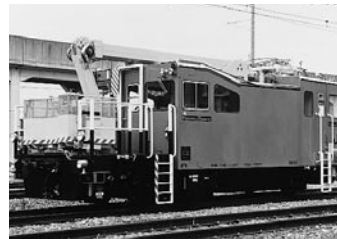
バケットワゴン(新幹線)

新幹線と在来線の2種類があり、高所設備の点検、検査に用います。多関節をもったブームとバケット内の操作パネルで電線や支持物を自在によけながら高所（15m）にある設備まで近づくことができます。