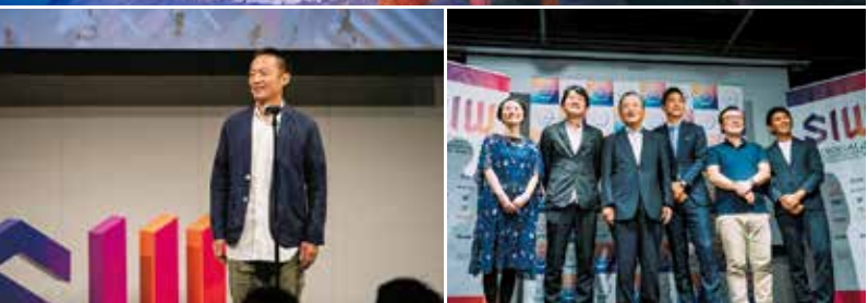
昨年のSIWは、ソーシャルイノベーションをキーワードに開催。「本質」をテーマにしたトークセッションでは50名以上が登壇した