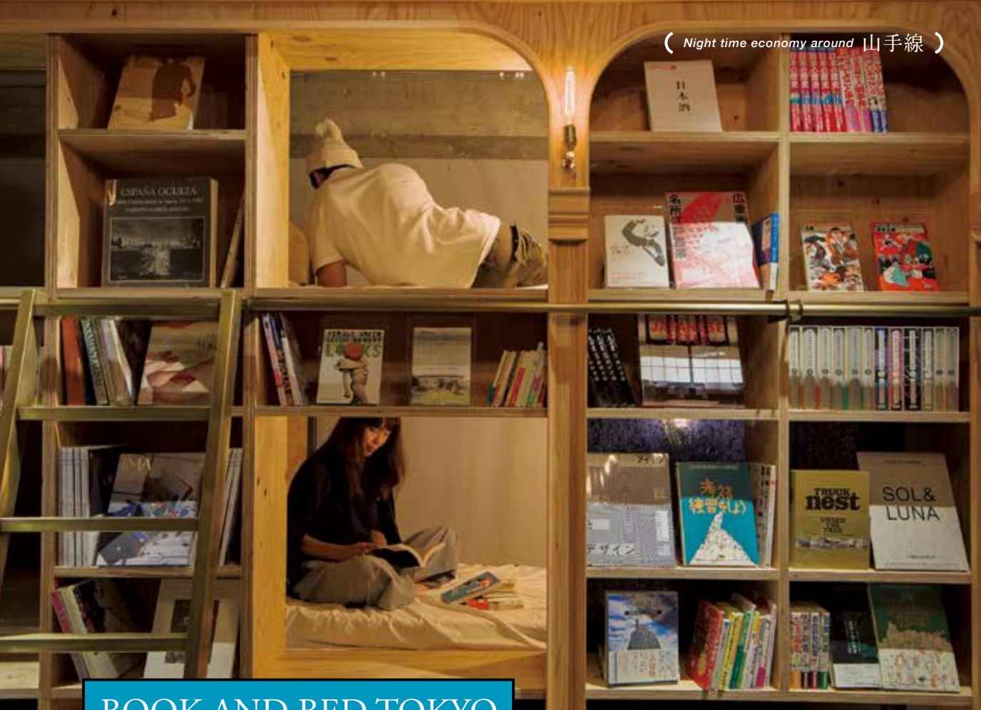
BOOK AND BED TOKYO