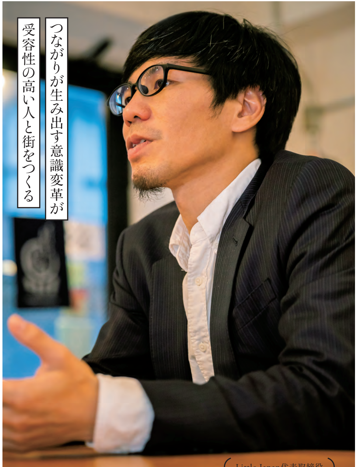
( Little Japan代表取締役 )