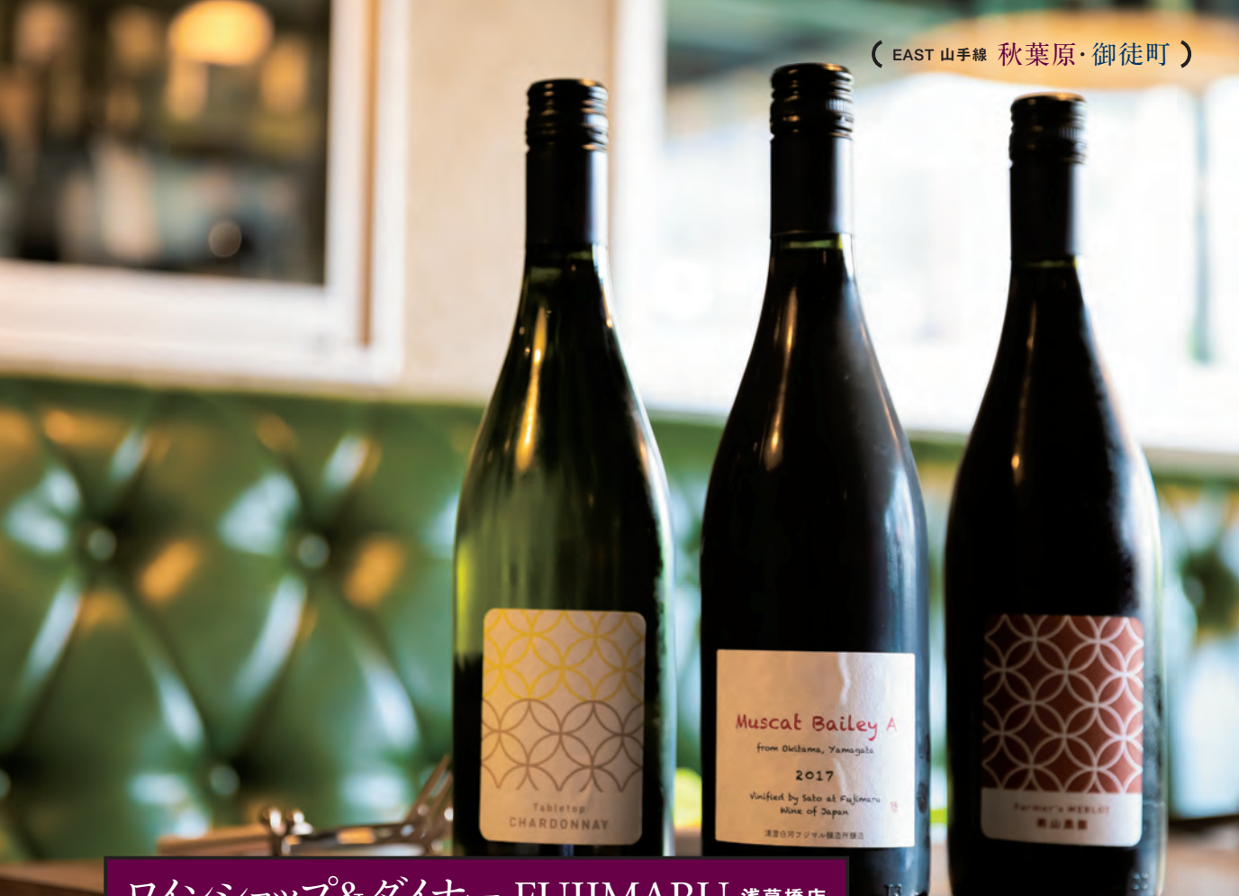
ワインショップ&ダイナー FUJIMARU 浅草橋店