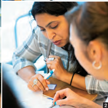
1・2・3) 2019年5月31日「Global Community Cafe」のオープニングイベントが開催。地元の外国人や地域住民、日本人ボランティアなど大勢が集まり賑わいをみせた。簡単な自己紹介から始まり、テーブルを同じくした者どうしが談笑。外国語が苦手でもスタッフがサポートしてくれるので、言葉の壁を心配する必要はない