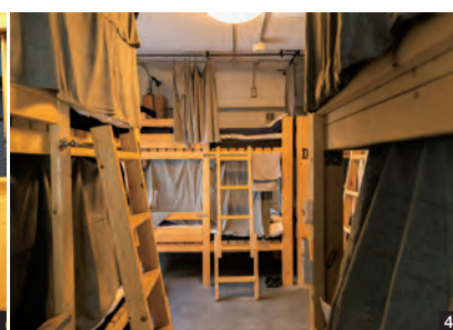
3) 各部屋にはすべて木製2段ベッドを設置。各ベッドには貴重品ボックスと小さな机、読書灯がついている。写真は2段ベッドが1台設置されているツイン。4) ドミトリーは女性専用と男女混合がある。5) 宿泊者専用の量のラウンジ。無料で利用できる冷蔵庫、ケトル、電子レンジも設置