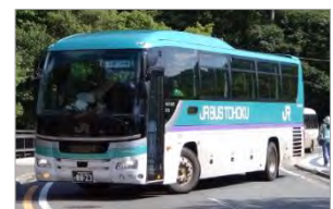
JR 巴士東北 湖號（青森站～十和田湖）