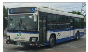
JR 巴士關東 路線巴士