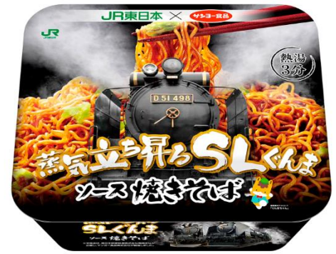
SLぐんまソース焼きそば （お持ち帰り用）