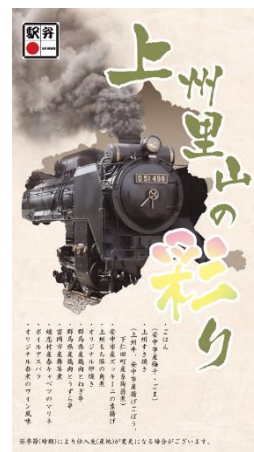
群馬DC特製弁当 「上州里山の彩り」

群馬DC特製弁当（オリジナル掛け紙付）、 蒸気立ち昇るSLぐんまソース焼きそば（イメージ）