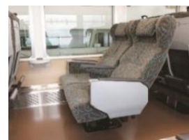
「リゾートやまどり」外観・車内