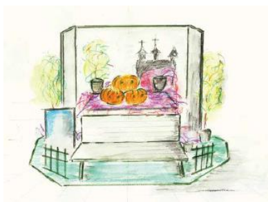
フォトスポットイメージ