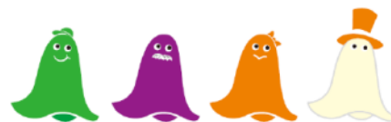
【おばけファミリー】