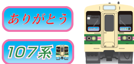
【前面シールイメージ】