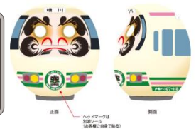
【オリジナルだるま】 ※信越本線のみ