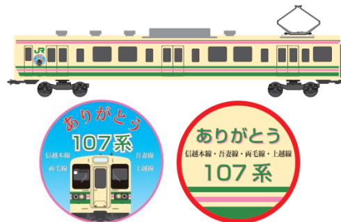
【側面シールイメージ】