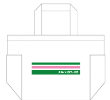
【オリジナルランチBOX】 【オリジナルバッグ】