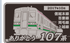
【記念ミニプレート】