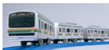
【プラレール特別賞】プラレール (S-43 サウンドE231系近郊電車)