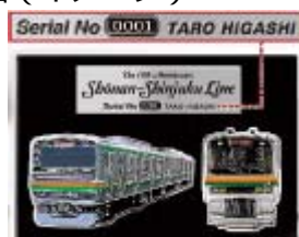
【プレミアム賞】当選者氏名刻印入り オリジナル湘南新宿ラインピンズセット