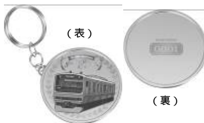
【ミドル賞】天賞堂製 オリジナル真鍮キーホルダー