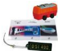
【ビギナー賞】鉄道グッズセット