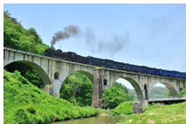
宮沢賢治の世界が広がる SL 銀河