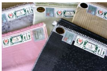
奈良時代から続く織物 結城紬