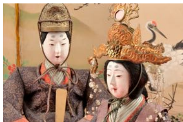
北前船で運ばれた雛人形

東日本エリアにも多くの地域に「雛祭り」文化が残っています。この旅では、色濃く雛の文化が残る酒田（山形県）に北前船で運ばれて大切に保管されてきた雛人形を見ながら雛巡りをいたします。翌日は、宮沢賢治の描いた「イーハトーヴ(理想郷)」の世界を、SL 銀河を貸し切ってお楽しみいただきます。3日目は那須（栃木県）で朝食の後、結城（茨城県）にて結城紬の文化に触れていただきます。