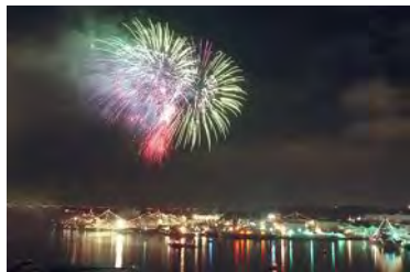
カウントダウンの様子

初日の出は、房総半島の和田浦（千葉県）にて眺め、鹿島神宮（茨城県）で初詣を行います。