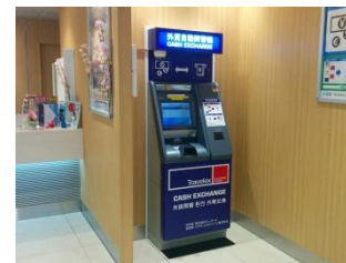
新宿站新南口 JR 东日本旅行服务中心