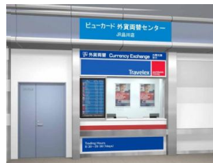
品川站中央检票口旁