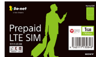
Prepaid LTE SIM（外包装）