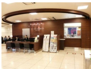
东京站 GRANSTA VIEW Square 内

为应对车站内外币兑换的需求，在东京站、品川站、新宿站内开设外币兑换中心和设置外币兑换机，预计今后将持续扩大推广。(运营公司:株式会社铁路会馆(东京站)、株式会社 Viewcard (品川站、新宿站))