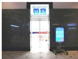
东京站丸之内北口 JR 东日本旅行服务中心 (包含外币自动兑换机)