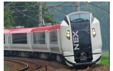
N'EX 东京往返车票有效范围