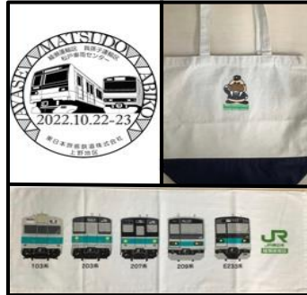
【特製ヘッドマークシール】 【綾瀬運輸区オリジナルグッズ(トートバッグ・タオル)】