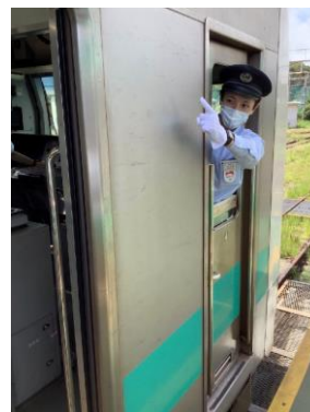
【E233系 車掌体験イメージ】