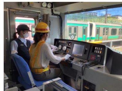
【E231系 運転操縦体験イメージ】