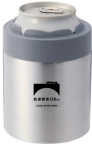
【鉄道開業150年 ロゴ入り缶ホルダー】