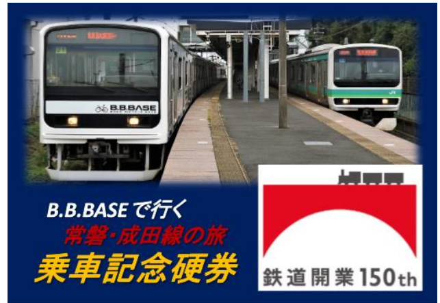
乗車記念硬券の台紙