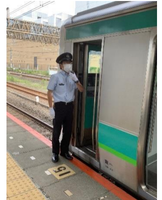
車内放送体験(イメージ)