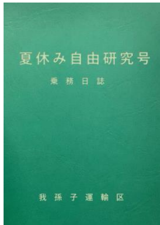
乗務日誌風ノート(表紙・内容例)