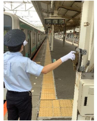
発車ベル体験(イメージ)