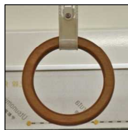
いろはで使用した吊り輪