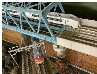
Nゲージレイアウト展示イメージ