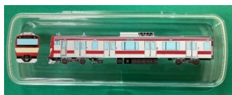
E531系赤電アクリルペンケース