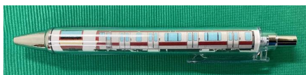
E531系赤電ボールペン