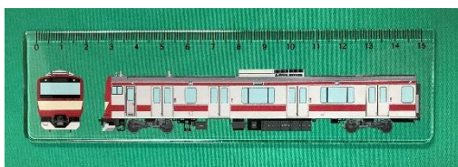
E531系赤電アクリル定規