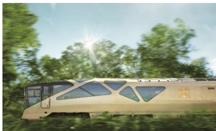
TRAIN SUITE 四季島

○申込方法：ホームページ https://www.jreast.co.jp/shiki-shima/ または「TRAIN SUITE 四季島」ご案内パンフレットに同封されている専用申込書でお申し込みください。ご案内パンフレットは、ホームページまたは「TRAIN SUITE 四季島」ツアーデスクにて受け付けています。