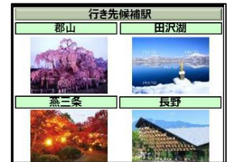
旅行先候補地（イメージ）

また、2022 年内に、今回の体験を JRE POINT でご利用いただけるサービスをはじめます。