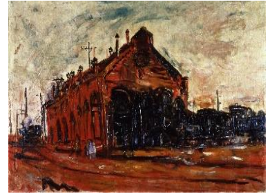
長谷川利行《赤い汽罐車庫》 1928 年 油彩・カンヴァス 鉄道博物館蔵

「東京ステーションギャラリー公式 HP」 https://www.ejrcf.or.jp/gallery