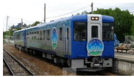
HIGH RAIL 1375