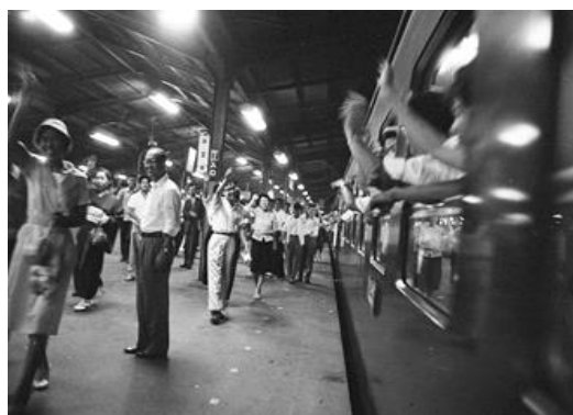
夜行列車の様子（1959年）