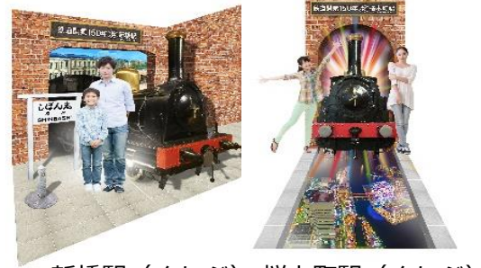
新橋駅（イメージ） 桜木町駅（イメージ）