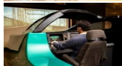
ホテルメトロポリタン エドモント ロビー