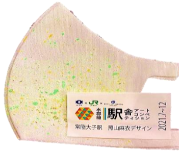
照山 麻衣氏 デザイン