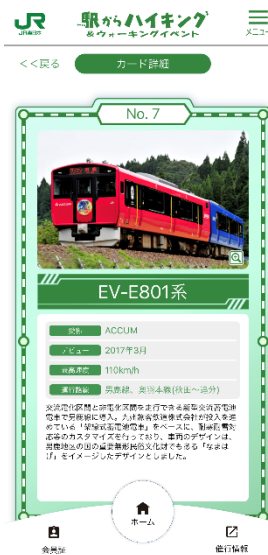
「列車カード」イメージ