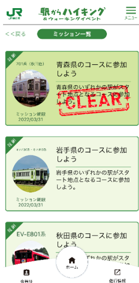
「ミッション一覧」イメージ