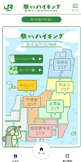
「カードコレクション TOP」イメージ

第一弾として、「駅からハイキング」のコースについて 22 のミッションをご用意しました。ミッションをクリアすることで、「列車カード」をアプリ内で集めることができます。今後、ミッションや列車カードの追加も予定しておりますのでご期待ください。