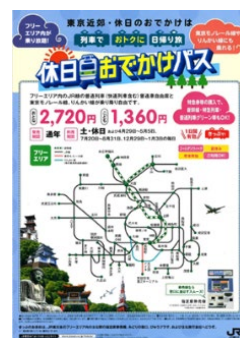
休日おでかけパス

※JR東日本の「おトクなきっぷ」の詳細は、こちらをご覧ください。 https://www.jreast.co.jp/tickets/