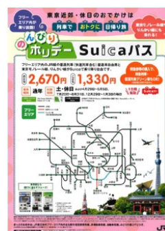
のんびりホリデーSuicaパス

※特急券等を購入すれば、特急列車・普通列車グリーン車も乗車可能です(新幹線は不可)。