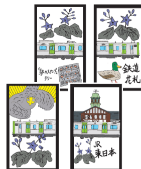
ラリー限定版 鉄道花札 イメージ

※賞品は数量限定、先着順、お一人様1個限りとなります。オリジナルの「鉄道花札」と異なり、お客さまご自身で切り離してご使用いただくシートタイプとなります。