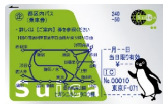
Suica「都区内パス」イメージ

※フリーエリア(東京23区内)外にもラニー対象駅がございます。これらの駅をまわる場合には別途運賃等が必要です。