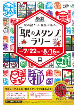
ポスターイメージ

※各駅の「駅のスタンプ」の設置場所やご利用が可能な時間の詳細は、7月22日以降、当社ホームページ内「首都圏スタンプラリー情報局」にてお知らせします。