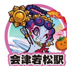
キングボンビーJr. ポコン