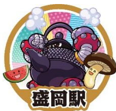
鉄器怪獣アイアンナンプ