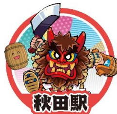
男鹿半島怪獣ナマハーゲン