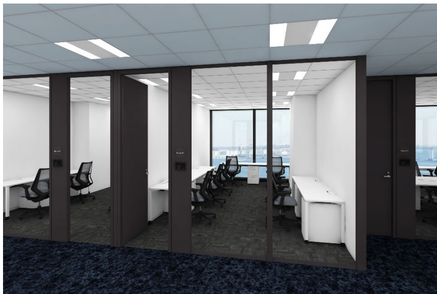
13 階 個室