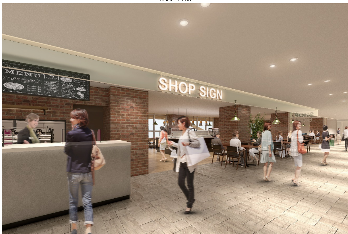
3階 ラウンジ前店舗