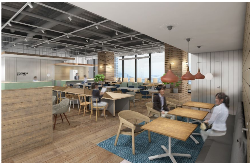
12 階 ラウンジ