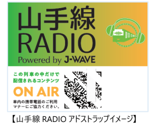
【山手線 RADIO アドストラップイメージ】

アドストラップ(つり革ステッカー)の二次元コードを読み込むと、コンテンツにアクセスできます。