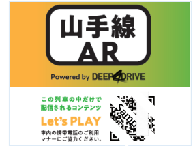
【山手線 A R アドストラップイメージ】