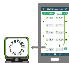
山手線(トレインネット)アイコン表示イメージ

運行状況は、JR東日本アプリ内の[列車走行位置]⇨[山手線(トレインネット)]で配信を予定しています。