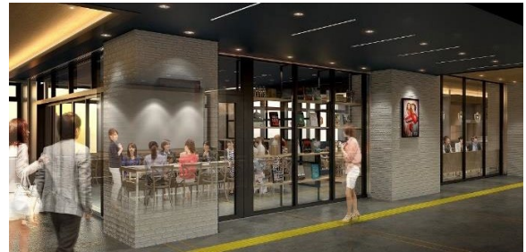
「エキラボ niri」イメージ

規模: 約40㎡ 営業時間: 7時00分～21時00分(予定) 設備: 机・椅子(30脚程度)、シンク、 プロジェクター、ホワイトボード 等 事業主: 東日本旅客鉄道株式会社 運営者: 株式会社 HAGI STUDIO 開業日: 2019年10月11日(予定)