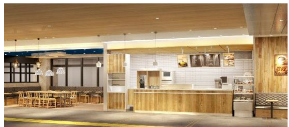
「BECK'S COFFEE SHOP 西日暮里店」イメージ

規模: 138㎡ 営業時間: 7時00分～21時00分(予定) 設備: 客席(約50席)、Free Wi-Fi、電源 事業主: ジェイアール東日本フードビジネス株式会社 運営者: ジェイアール東日本フードビジネス株式会社 開業日: 2019年10月1日(予定)