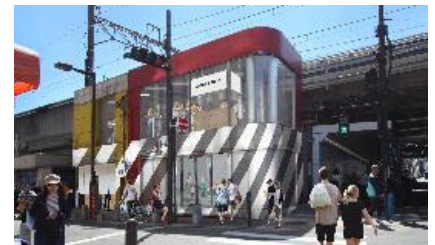
「西日暮里スクランブル」イメージ

規模: 約120㎡(地上2階建) 営業時間: 各テナントによる 事業主: 株式会社ジェイアール東日本都市開発 運営者: 株式会社 HAGI STUDIO 開業日: 2019年11月(予定)