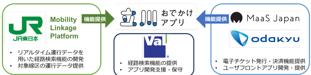
図1 本実証実験の企画提案企業と各社の役割

三者は、「立川おでかけアプリ」でご提供するサービスやアプリそのものの操作性等をより良いものにしていくことを目指しており、多くの方に本実証実験にご参加いただきたいと考えております。