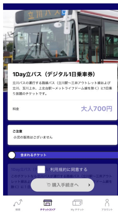
図3 電子チケット購入画面イメージ