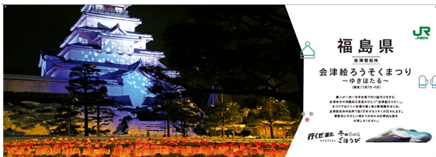
【福島県（会津若松市）】