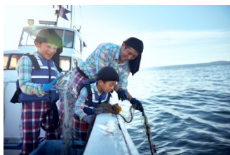
地元の漁師さんと一緒に漁に出よう！「星野リゾート リゾナーレ熱海」食育体験 1泊2日（静岡県）