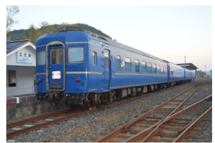
昔の寝台特急車両に泊まろう！「小坂鉄道レールパーク」と世界遺産の森「白神山地」の大自然を探検！（秋田県）