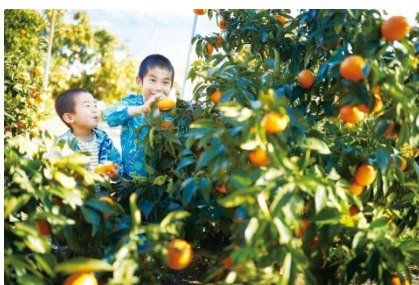
【海を眺めながらのみかん狩り】

東京駅をゆっくり出発して、向かうは風光明媚な温泉地・熱海。海が見える農園で暖かい気候が育んだみかんを自分で獲って食べてみよう！宿泊する「星野リゾート リゾナーレ熱海」では、翌日の漁に向けて魚の種類を勉強したり体力づくりのクライミングウォール体験も。2日目は熱海の海を知り尽くした漁師さんとの刺し網漁体験！親子で力を合わせてたくさんの魚を引き上げよう！自分で獲った魚で作るパエリアで楽しいランチタイムも♪