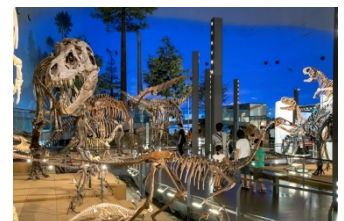
運転士さんになろう！本物の電車を運転体験「えちぜん鉄道」と恐竜の化石見つかるかな?!発掘体験と「福井県立恐竜博物館」（福井県）