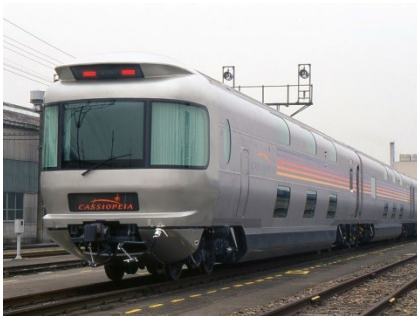
【カシオペアで盛岡駅へ】

思い出づくりにピッタリ！「カシオペア」に乗って秋の三陸へ！寝台列車の旅を一晚楽しんだ後は、海と山に囲まれた自然豊かな釜石へ！地元の漁師さんと漁船に乗ってお仕事を見学したり、東日本大震災で多くの命を救った「いのちの道」で防災を学ぼう。3日目の三陸鉄道リアス線ではレトロでかわいい車両を貸切運行♪三陸復興国立公園の中にある浄土ヶ浜遊覧船で船を追いかけるように飛ぶウミネコに餌をあげてみよう！