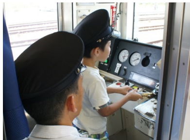
【本物の電車運転体験】