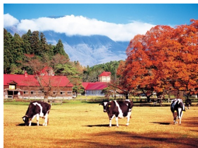
「カシオペア」乗車と酪農のめぐみにふれる！小岩井農場満喫プログラム（岩手県）