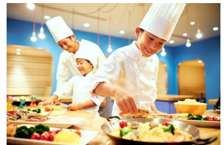
【自分でつくるパエリアのランチ】