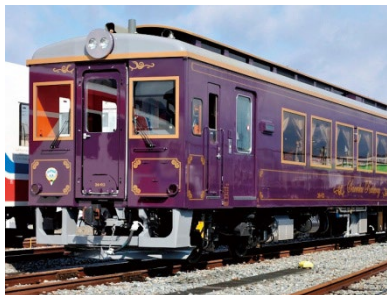
「カシオペア」貸切の「三陸鉄道」と三陸で漁師さんのお仕事見学（岩手県）