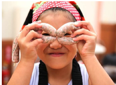
【ウインナーづくり体験】