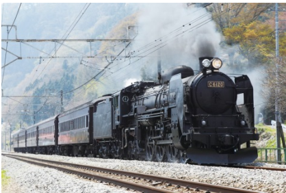
【カッコいい「SLぐんま みなかみ」】

たのしい2つの列車に乗車！煙を吐きながら力強く走る「SLぐんま みなかみ」と、窓ガラスがなく吹き込む風が気持ちいい「トロッコわっしー号」に乗車します。2つの料理体験ではウインナー作り（1日目）と古代料理作り（2日目）に挑戦！新鮮なお肉と本格スパイスを使って作るウインナーの味は格別♪また、石器や土器を使ってみれば古代の人々の生活を体感できるかも？群馬県民が愛する「焼きまんじゅう」の味見もしておいしい群馬を満喫しよう！