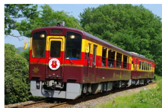
「SLぐんま みなかみ」・「トロッコわっしー号」に乗車 作って食べるおいしい群馬 2日間（群馬県）