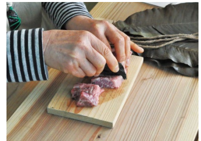
【黒耀石のナイフで肉切り】