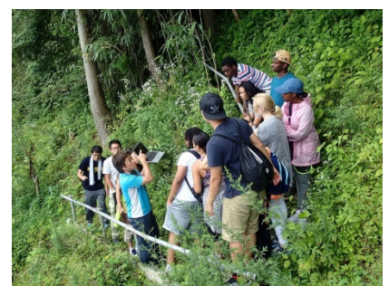
【「いのちの道」で防災を学ぼう】