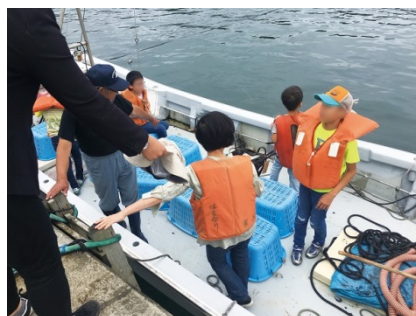
【漁師さんのお仕事見学】