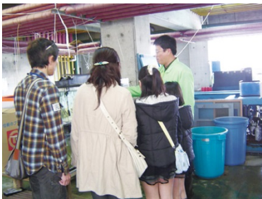
【水族館の裏側を探検】

エリア初登場！越前松島水族館では、職員さんの案内で 研究用の水槽や出番を待っている魚たちがいる裏側を特別に覗いてみよう！ えちぜん鉄道では、 運転指令所や車庫見学のほかなんと本物の電車の運転体験も！ 2日目には日本を代表する恐竜化石発掘のまち勝山で、大迫力の恐竜骨格標本を見学したり、恐竜の化石発掘に挑戦！貝や植物の化石のほか、 運が良ければ恐竜の化石を探し当てちゃうかも？！