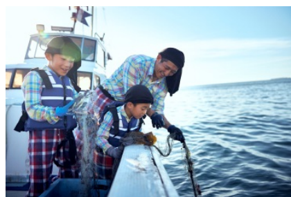
【漁師さんとの刺し網漁体験】