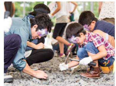
【恐竜化石発掘体験】