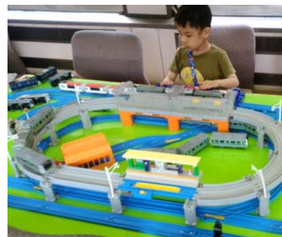
お座敷プラレール号 「イベントカー」車内