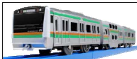
プラレール「E233系湘南色」