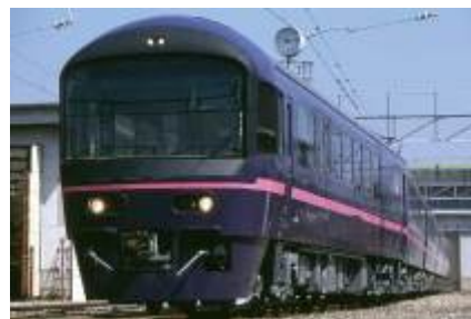
お座敷プラレール号