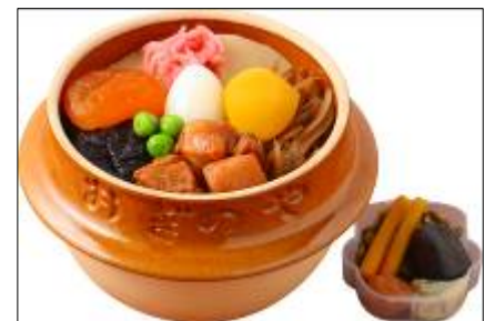
おぎのや「峠の釜めし」