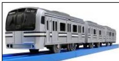
プラレール「E217系横須賀線」