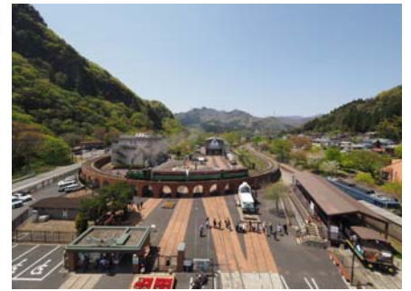
碓氷峠鉄道文化むら